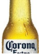
Corona Extra a felejthetetlen nyári pillanatokhoz