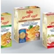
Már a tévé képernyőkön is hódít a Hajdú grill sajt