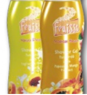
Két új tusfürdővel jelenik meg a Fruisse termékcsalád