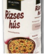
Kerek szemű rizs